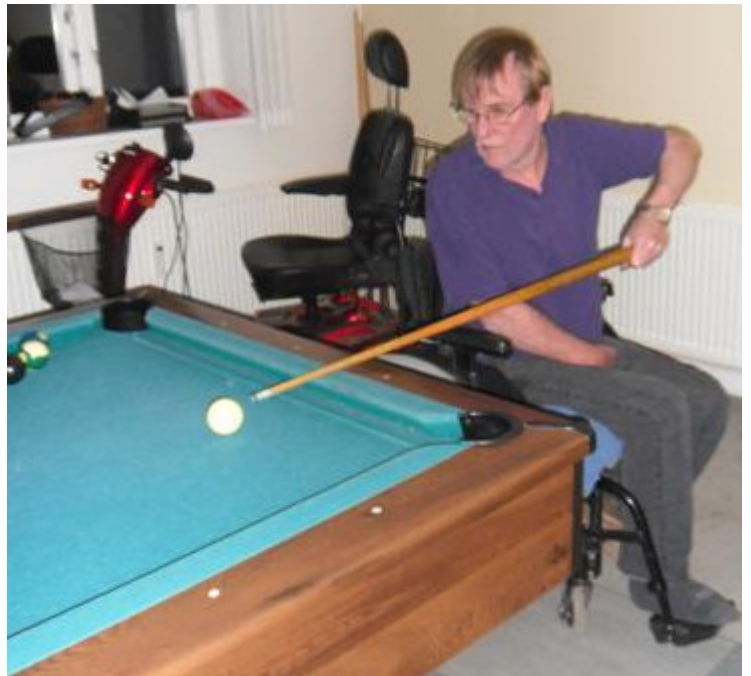
Fotos: Herover ses aftenens vinderteam. Der blev spillet billard til langt ud på aftenen.