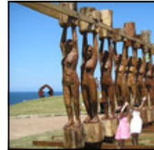
Foto: Der bliver rig lejlighed til at se på udendørs kunst næsten lige uden for vores dør, når Sculpture by the sea igen gæster Aarhus.