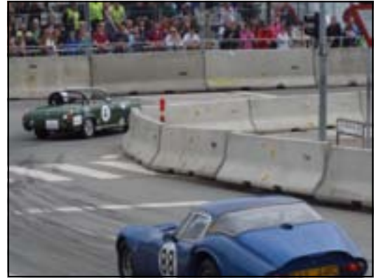
Foto fra sidste års Classic Race.

Sculpture by the Sea indtager igen strækningen fra Tangkrogen til Ballehage Strand, som de gjorde i 2009, med 60 skulpturer skabt af forskellige internationale kunstnere.