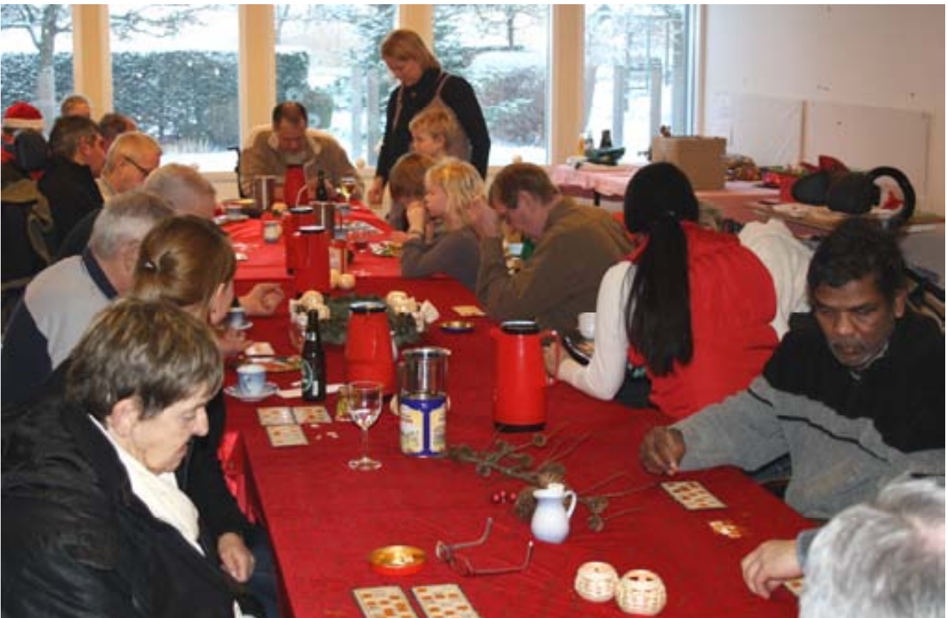
Foto nederst: Der var fuld fokus på pladerne til det årlige Julebanko .

Der var som sædvanlig også rigtig mange julearrangementer på Stefanshjemmet i årets sidste måned i 2010. Over alt var der en dejlig varm stemning. Der var Julekoncert, julefrokost, julebanko, julegudstjeneste, og meget mere.