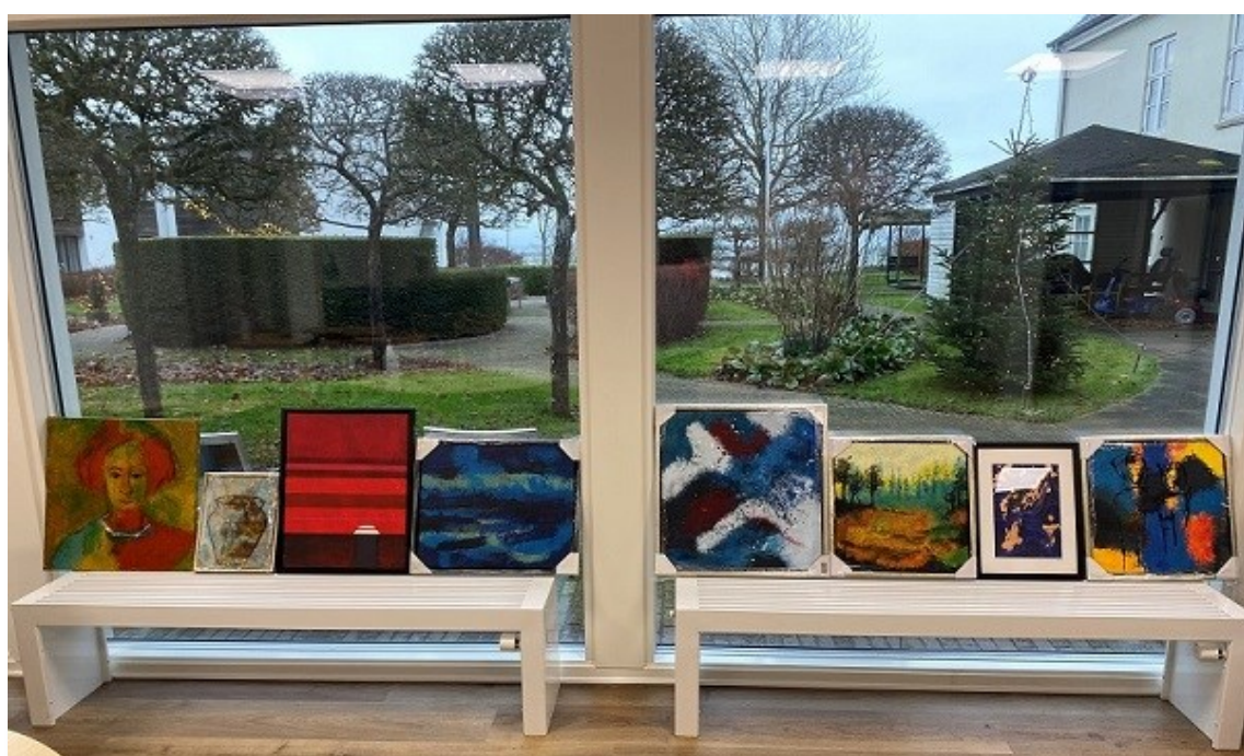
Foto. Gittes malerier kan lige nu ses på Gallerigangen frem til april måned.